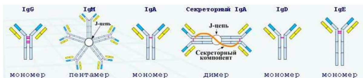
Рисунок 1. Классы антител человека.

Наша иммунная система вырабатывает 5 классов антител: IgG, IgM, IgA, IgE и IgD (рис.1), мы рассмотрим 3 из них.