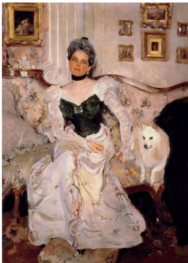
в) Валентин Серов. Портрет Зинаиды Юсуповой. 1902