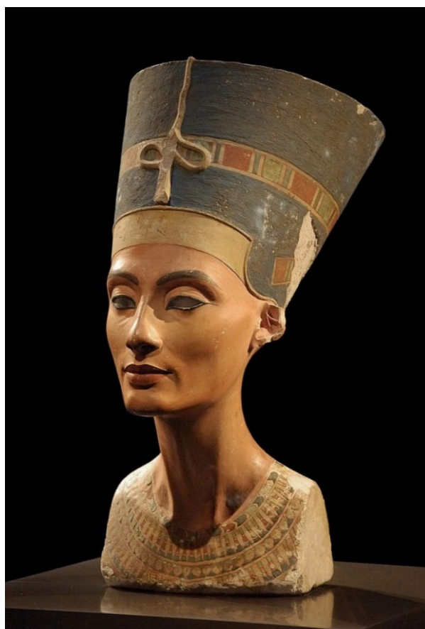
г) Бюст Нефертити. Ок. 1351—1334 до н. э.