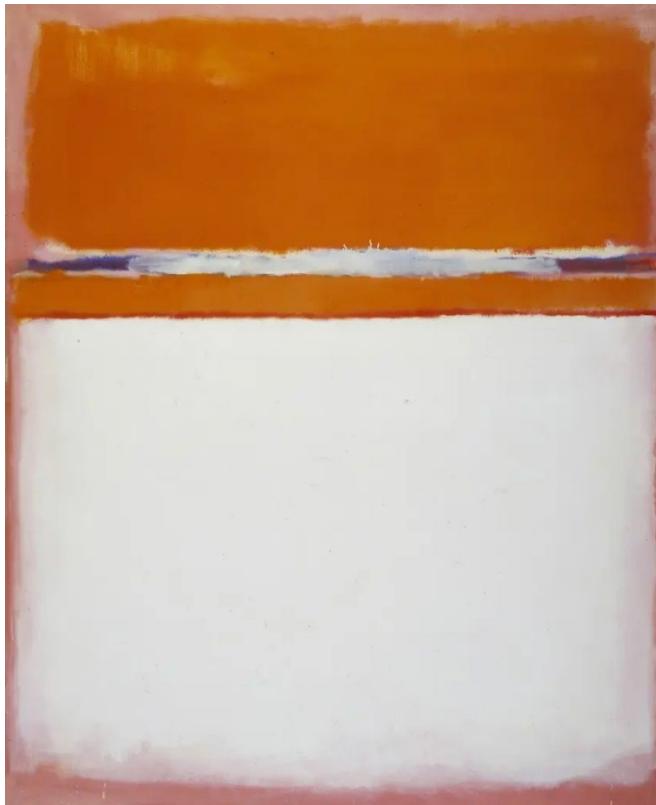
а) Марк Ротко. №18. 1951.

Задание 3 (50 баллов). Напишите эссе объемом не менее одного листа на заданную тему. Выберите один из предложенных шедевров и проанализируйте его, указывая на индивидуальные особенности произведения, стиль автора и характерные черты эпохи, к которому относится данное произведение. Порассуждайте о том, какое место данная работа занимает в истории искусства. Выразите свое отношение к этому произведению.