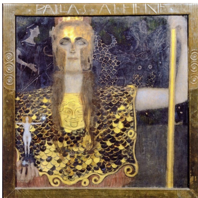
б) Густав Климт. Афина Паллада. 1898