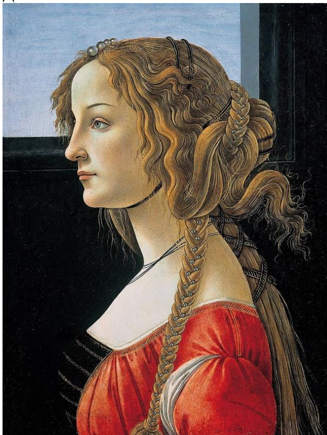
Сандро Боттичелли. Портрет молодой женщины. 1476—1480.