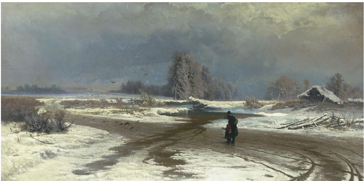
Федор Васильев. Оттепель. 1871