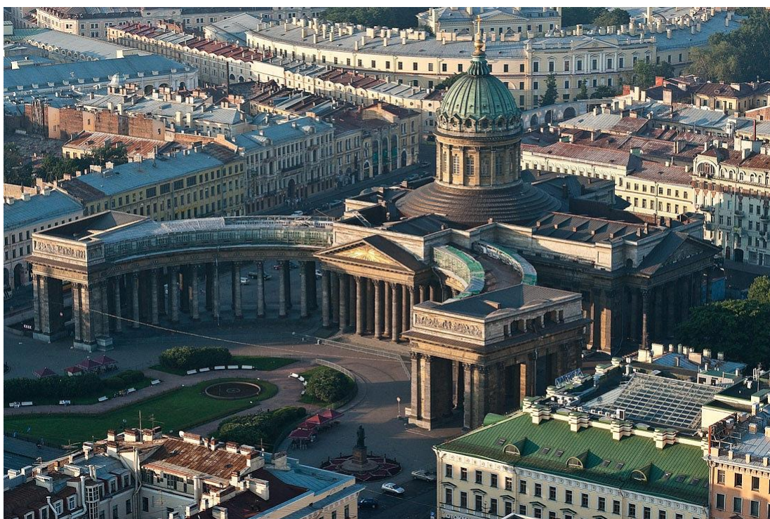
Андрей Воронихин. Кафедральный собор Казанской иконы Божией Матери. 1801—1811 годы