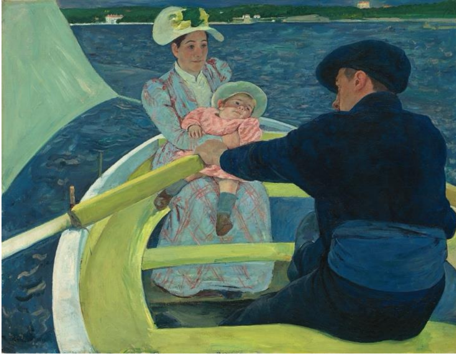
Мэри Кэссетт. Прогулка на лодке 1893-1894.

Часть 3. (максимум — 50 баллов). Напишите эссе объемом не менее одного листа на заданную тему. Выберите один из предложенных ниже шедевров и проанализируйте его, указывая на индивидуальные особенности произведения, стиль автора и характерные черты эпохи, к которому относится данное произведение. Порассуждайте о том, какое место данная работа занимает в истории искусства. Выразите свое отношение к этому произведению.