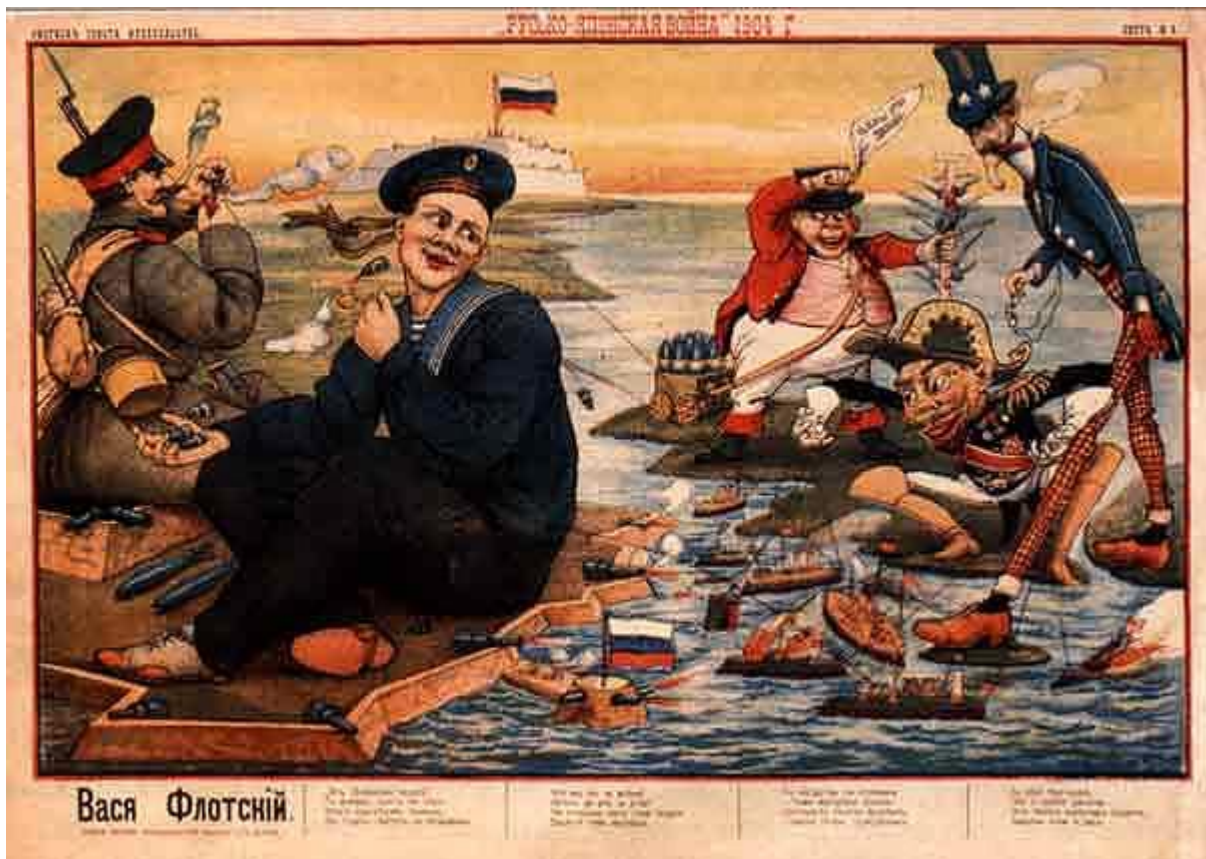
И снова - русский плакат, на котором Вася Флотский лениво закидывает японцев снарядами. А его сухопутный коллега отдыхает, наслаждаясь дымом трубки.

Межрегиональная олимпиада школьников «Высшая проба»,