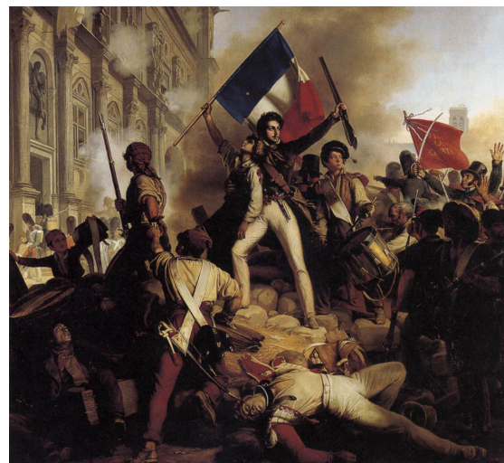
The Battle for the Town Hall, 28 July 1830. SCHNETZ, Jean-Victor.

В XVIII веке появился новый краситель, давший цвет - индиго, а также берлинская лазурь. Использовать синий цвет стали повсеместно. Благодаря работе ученых, синий стал одним из трех основных цветов.