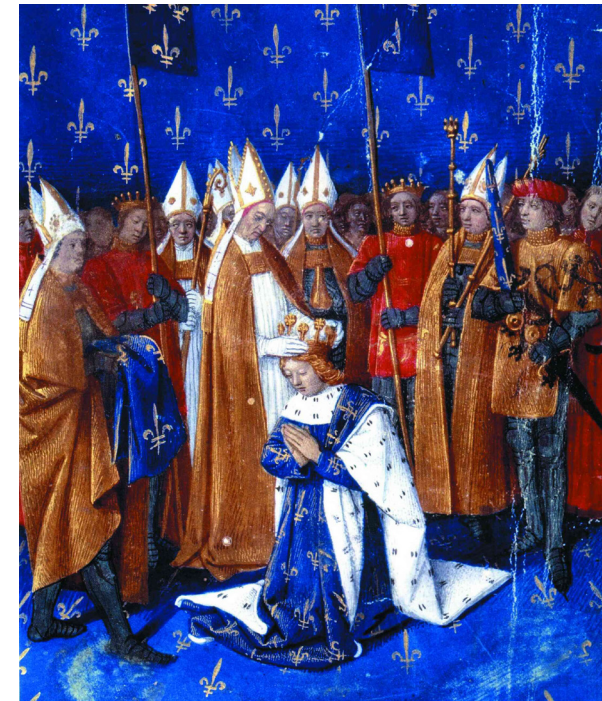
Коронация карла IV. XIV век.

Чума, разразившаяся в XIV веке, и голод заставили людей отказаться от ярких цветов. Появилось огромное количество законов, предписывающих каждому из сословий что и когда надевать, одежда отличалась также и в зависимости от рода деятельности, кричащими же цветами «помечали» неугодных граждан. Так во многих странах красный стал цветом палачей. Однако, все своды законов, предписывающие цвета в одежде, обошли, кроме черного и белого, только синий, как цвет истинной чистоты.