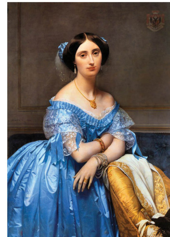
Энгр. Ingres princesse