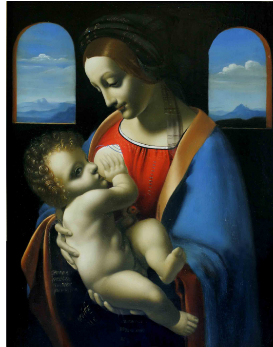
«Madonna Litta». Leonardo da Vinci 1490-91

Реформация, борющаяся с роскошью на всех фронтах, пощадила лишь синий цвет, поставив его в ряд с черным, белым и серым. Его снова спасло придаваемое ему значение, синий цвет остался символом чистоты, в то время как все яркие цвета объявили ненужной и неуместной роскошью.