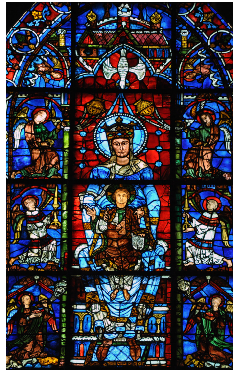
Витраж Шартрского собора.

Чума, разразившаяся в XIV веке, и голод заставили людей отказаться от ярких цветов. Появилось огромное количество законов, предписывающих каждому из сословий что и когда надевать, одежда отличалась также и в зависимости от рода деятельности, кричащими же цветами «помечали» неугодных граждан. Так во многих странах красный стал цветом палачей. Однако, все своды законов, предписывающие цвета в одежде, обошли, кроме черного и белого, только синий, как цвет истинной чистоты.