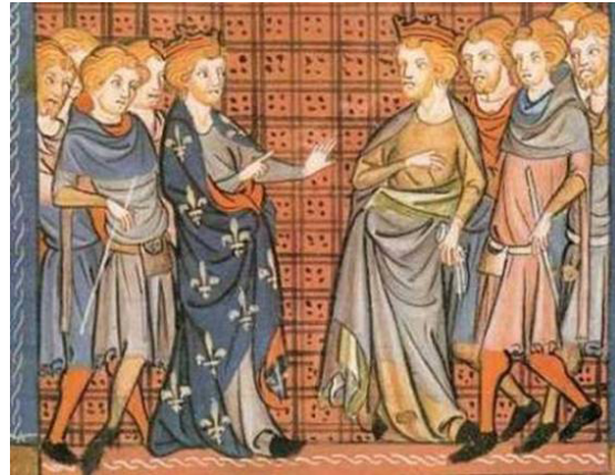
Филипп II Август

В XI веке все круто изменилось. С этих пор синий больше никогда не исчезал из списка главных цветов.