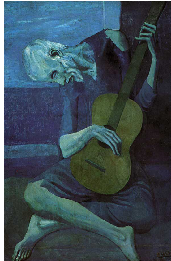
Пабло Пикассо. Старый гитарист

У Пабло Пикассо синий стал символом одного из наиболее тяжелых периодов в жизни.