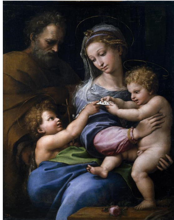
Малое святое семейство. Рафаэль 1518

Возрождение сделало живопись одной из первых форм изобразительного искусства. Искусство стало светским, однако значения цветов были унаследованы от традиций иконописи.