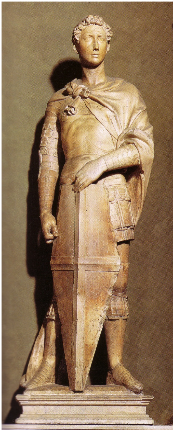
Донателло. Святой Георгий. Мрамор. Ок. 1416.