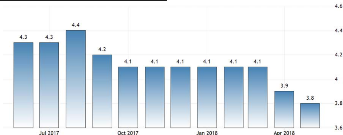
Уровень безработицы в США (2017-2018)

Дерьмовая работа для каждого не решает социальных проблем. Среди работающих взрослых американцев четверть зарабатывает меньше уровня, за которым лежит бедность; как результат, 21% детей официально считаются бедными.