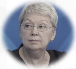
Ольга Васильева Министр образования РФ

«Дело в том, что без мифологизации нельзя... Понимаете, без героев, без героического облика исторических персонажей нельзя обойтись. Будь ты маленький человек, будь ты взрослый, у тебя должен быть идеал, к которому нужно стремиться».