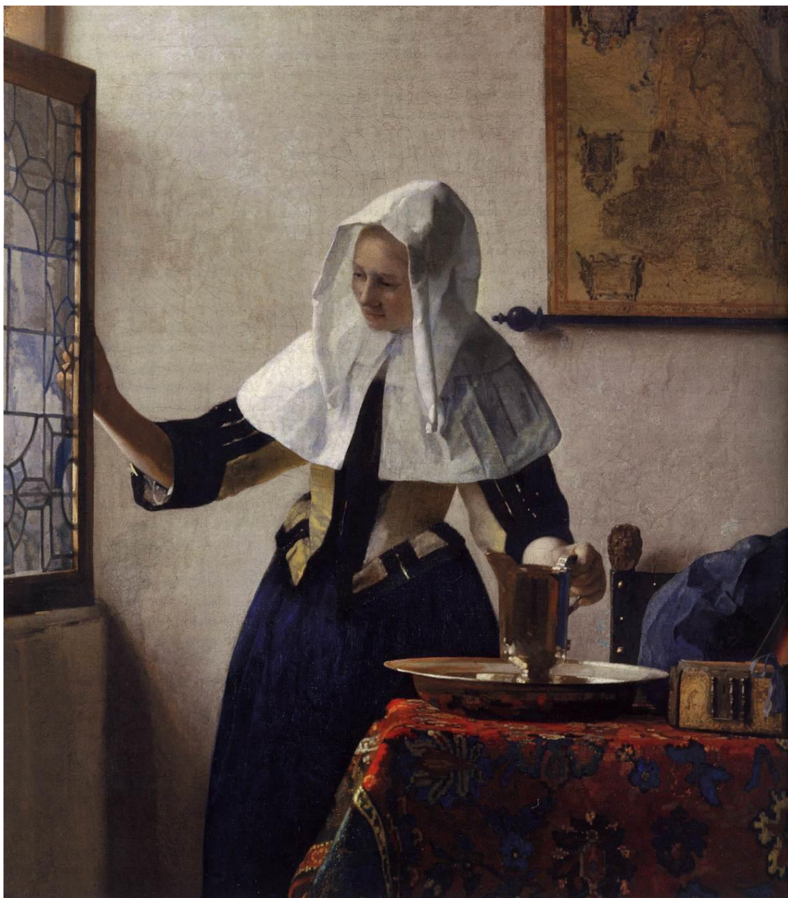
б) Ян Вермеер. Молодая женщина с кувшином воды. 1662.