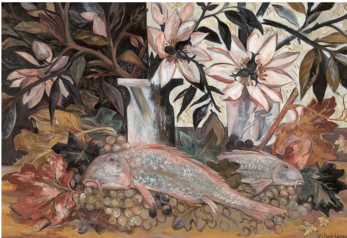
а) Наталья Гончарова. Натюрморт с барабулькой и магнолиями. Около 1928 года.

Выберите один из предложенных шедевров и проанализируйте его, указывая на индивидуальные особенности произведения, стиль автора и характерные черты эпохи, к которому относится данное произведение. Порассуждайте о том, какое место данное произведение занимает в истории искусства. Выразите свое отношение к этому шедевру.