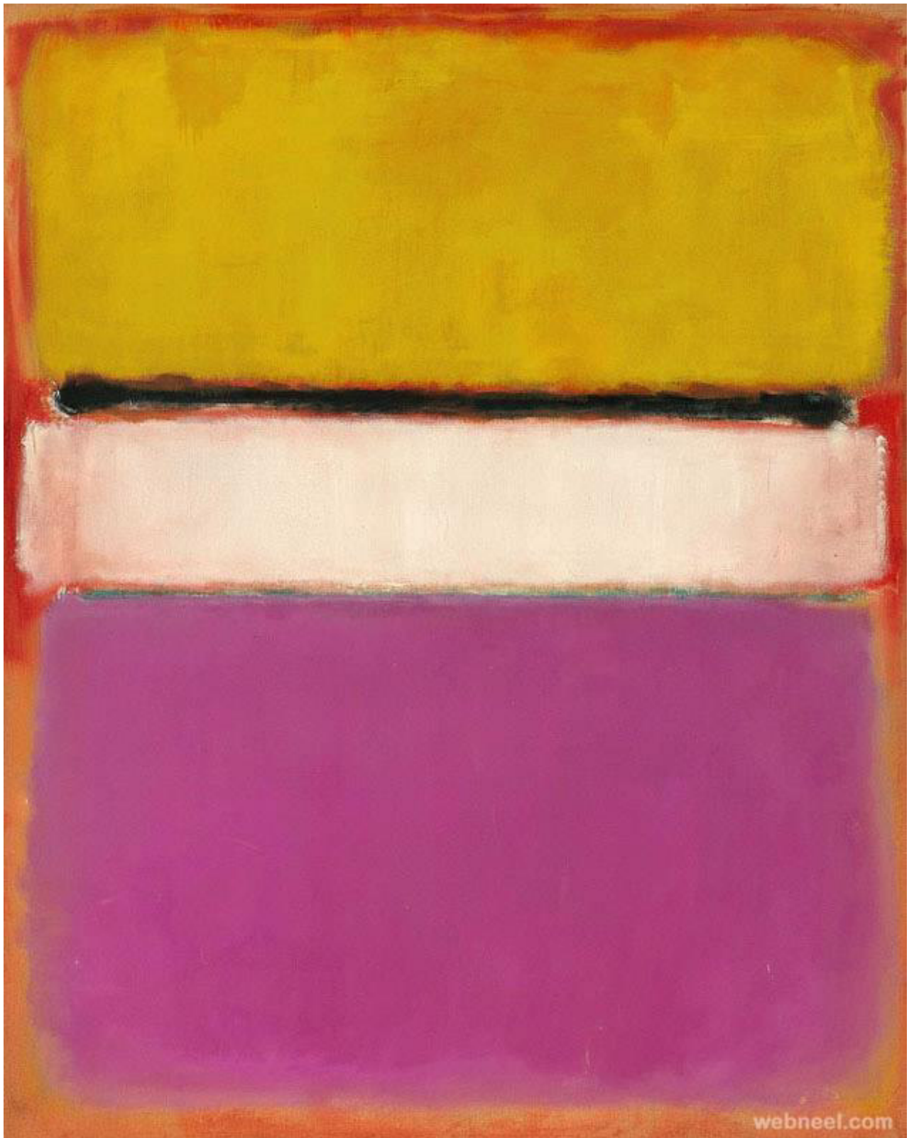
г) Марк Ротко. Белый центр. 1950.