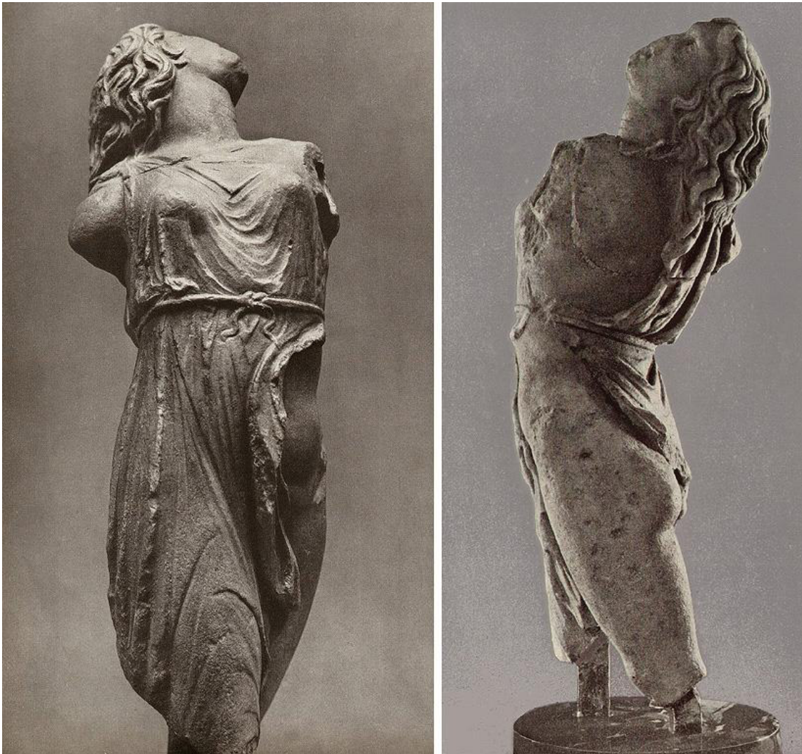
в) Скопас. Менада. Римская копия с греческого оригинала ок. 350 г. до н.э.