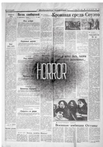
Дмитрий Пригов. Лист "Horror", из серии «Газеты». 2001