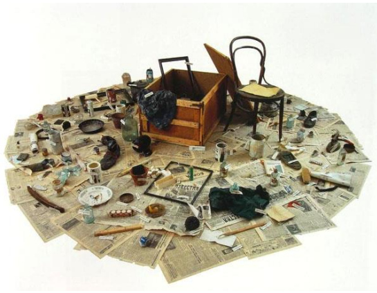
Илья Кабаков. Ящик с мусором. 2008