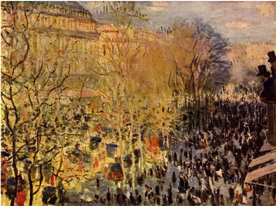
Клод Моне. Бульвар Капуцинок. 1873