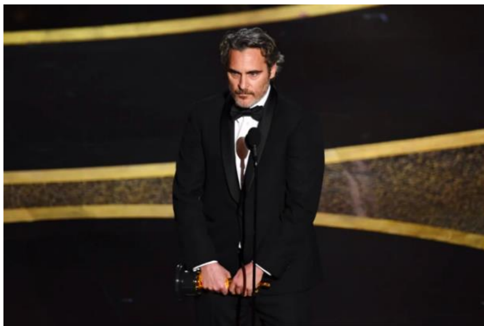
9 февраля 2020 г. Актер Хоакин Феникс, театр «Долби»

Определите информационный повод, который представлен на выбранной фотографии. В соответствии со стилистическими требованиями жанра, напишите новостную заметку, отражающую этот информационный повод. Придумайте заголовок к вашей новостной заметке. Лид заметки должен отвечать на следующие вопросы: «кто?», «что?», «где?», «когда?», «как?», «почему?».