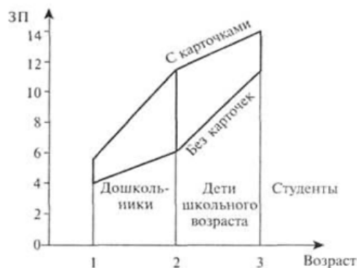
Рис. 11.1. «Параллелограмм развития» согласно результатам эксперимента А. Н. Леонтьева.

К какому типу экспериментального плана относится известный эксперимент А.Н. Леонтьева, результаты которого представлены на рисунке?