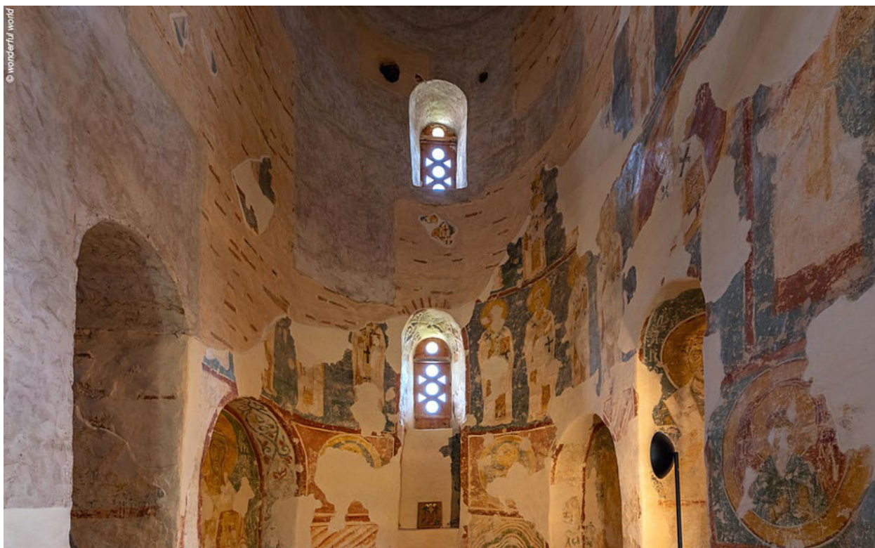
Церковь Спаса на Нередице. Постройка – 1198 год. Реставрация – 1944 – 1957, С.Н. Давыдов, Л.М. Шуляк, В.Н. Захарова, Н.В. Перцев, Г.М. Штендер.