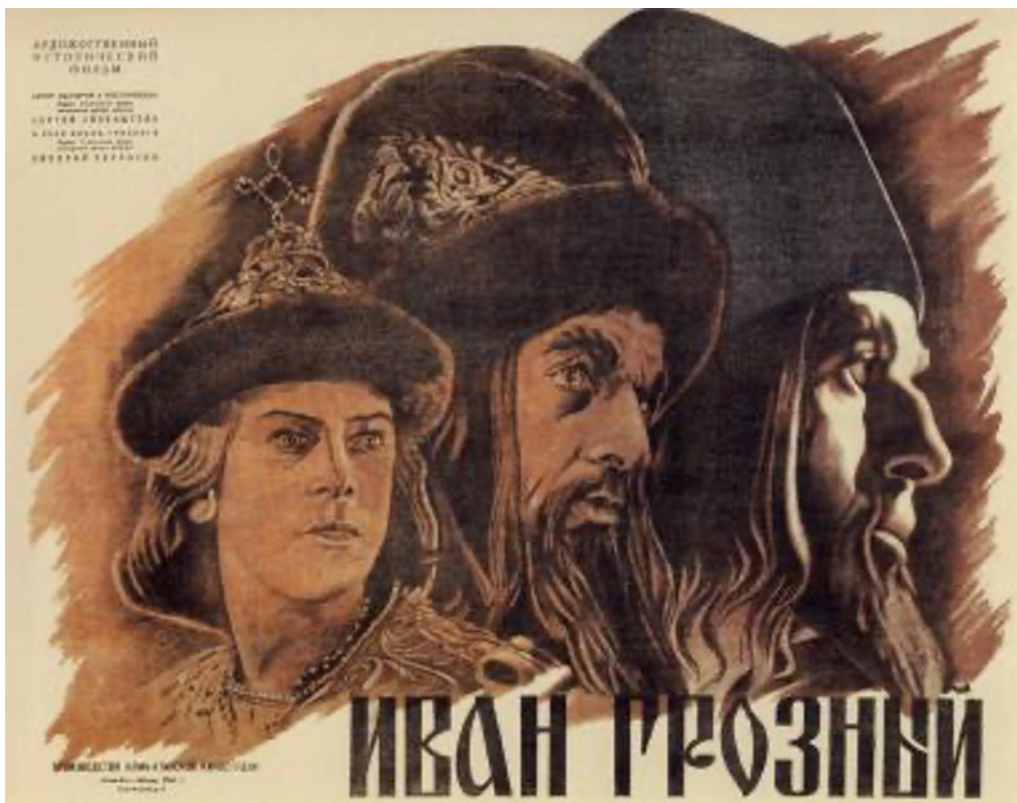
Афиша к фильму «Иван Грозный» (1944). Реж. С. Эзенштейн, СССР.