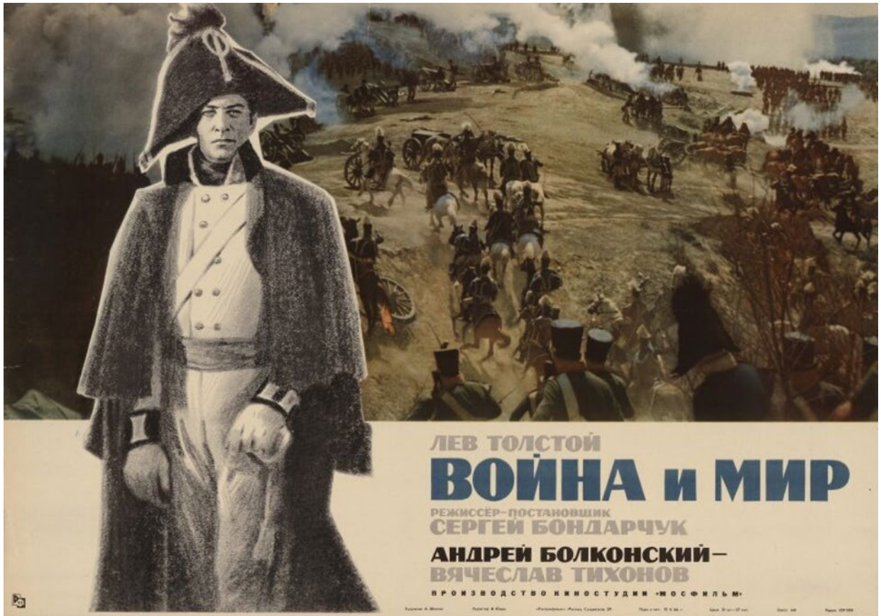
Афиша к фильму «Война и мир» (1965). Реж. С. Бондарчук, СССР.