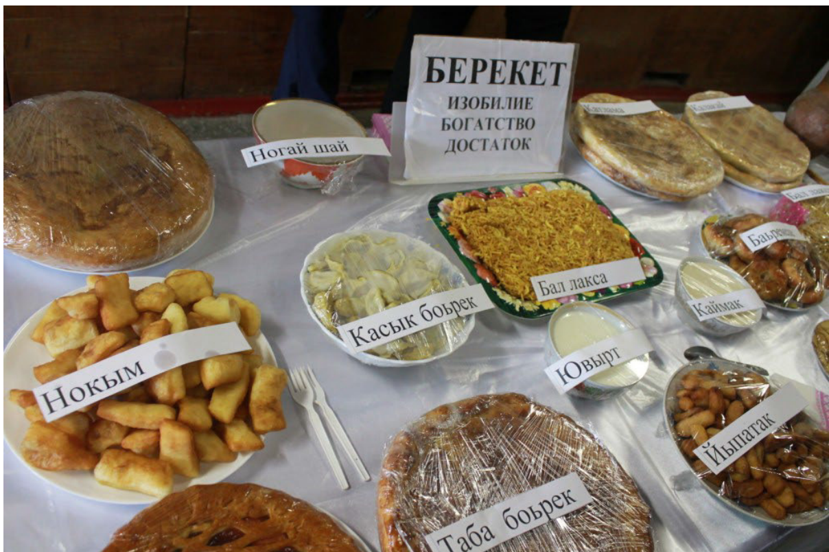
Праздничные угощения на Навруз у ногайцев