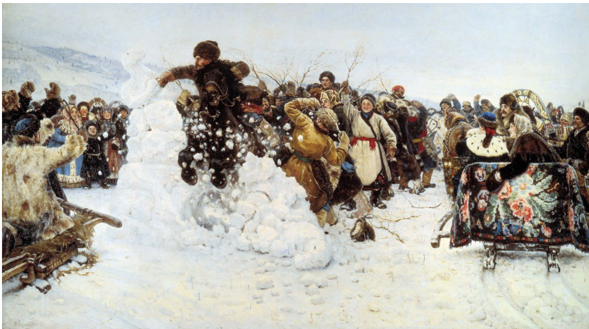
Василий Суриков. Взятие снежного городка (1891). 156 × 282 см, холст, масло. Государственный Русский музей, Санкт-Петербург.

Вопрос 1. Придумайте название выставки/спектакля/праздника. Напишите для выставки (А) или спектакля (В): краткую аннотацию - или - для праздника (С): текст приглашения, адресованные посетителям/зрителям/участникам.