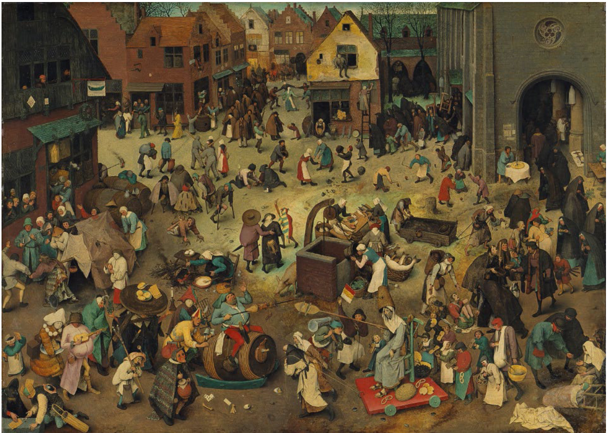
Питер Брейгель Старший. Битва Масленицы и Поста (1559). 118 × 164,5 см. Дерево, масло. Музей истории искусств, Вена.