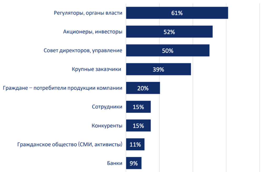
Рис. 2: Данные института государственного и муниципального управления НИУ ВШЭ.

Получается, что ESG-повестка в России меняется и расширяется, она никуда не пропадает и остается востребованной, пока страна находится в торговых отношениях с многочисленными партнёрами.