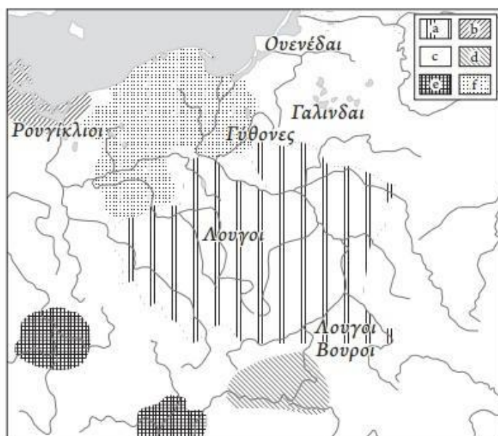
Рис. 2. Размещение племен Великой Германии и Европейской Сарматии согласно Птолемию, на фоне карты археологических культур центрально-европейского Барбарикума. а — пшеворская культура; б — густовская группа; с — западнобалтский культурный круг; д — пуховская культура; е — ареал маркоманов и квадов; ф — вельбаркская культура (по: Kokowski, 2005, map 10 , с изменениями автора)

Размещение племен Великой Германии и Европейской Сарматии согласно Птолемию